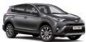
163 Сірий 5