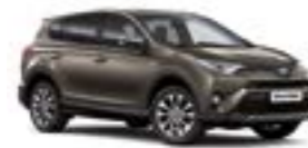
4T3 Бронзовий 5