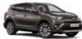
4U5 Темно-коричневий 5

Вся інформація, представлена у цьому матеріалі, є точною та дійсною станом на дату публікації 27.02.2017. Імпортер автомобілів Toyota залишає за собою право вносити зміни до інформації, наведеної в цьому матеріалі, без попереднього повідомлення.