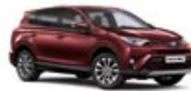
370 Темно-червоний 5