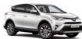
070 Білий перламутр 5