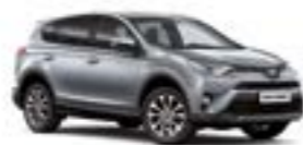
1D6 Сріблястий 5