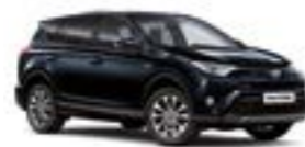
221 Темно-синій 5