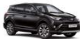
209 Чорний 5