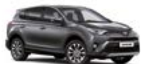
1G3 Сірий 2