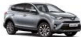
1F7 Сріблястий 2