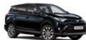
221 Темно-синій 2