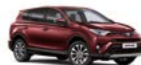
3T0 Темно-червоний 2