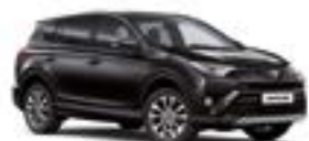
209 Чорний 2