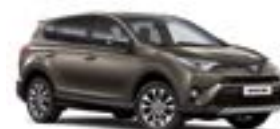
4T3 Бронзовий 2