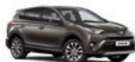
4U5 Темно-коричневий 2

Вся інформація, представлена у цьому матеріалі, є точною та дійсною станом на дату публікації 19.10.2016. Імпортер автомобілів Toyota залишає за собою право вносити зміни до інформації, наведеної в цьому матеріалі, без попереднього повідомлення.