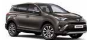
4U5 Темно-коричневий 2