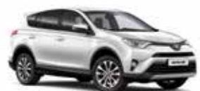
070 Білий перламутр 2