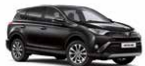
209 Чорний 2