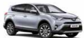
1F7 Сріблястий 2