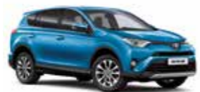
8X7 Блакитний 2

Вся інформація, представлена у цьому матеріалі, є точною та дійсною станом на дату публікації 06.07.2016. Імпортер автомобілів Toyota залишає за собою право вносити зміни до інформації, наведеної в цьому матеріалі, без попереднього повідомлення.