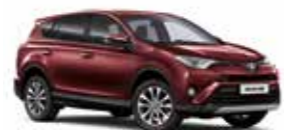
3T0 Темно-червоний 2