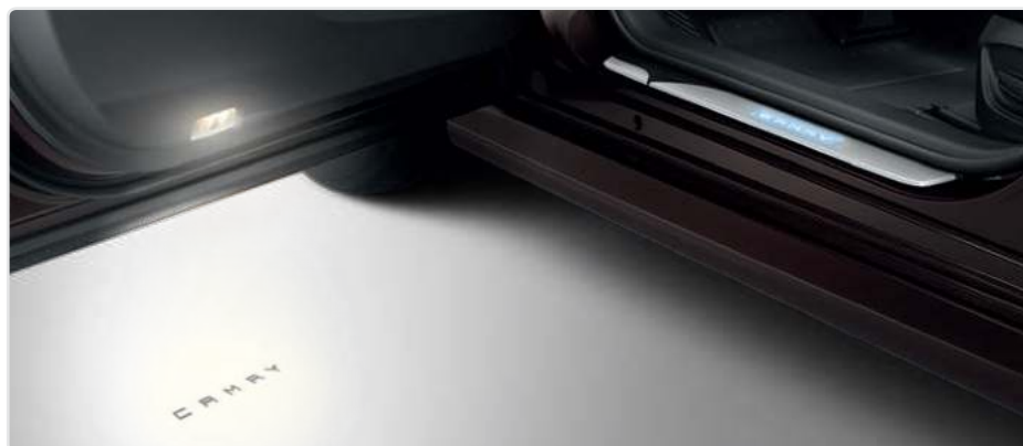
Проекція логотипа «Camry»