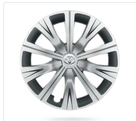
Легкосплавні диски 17"