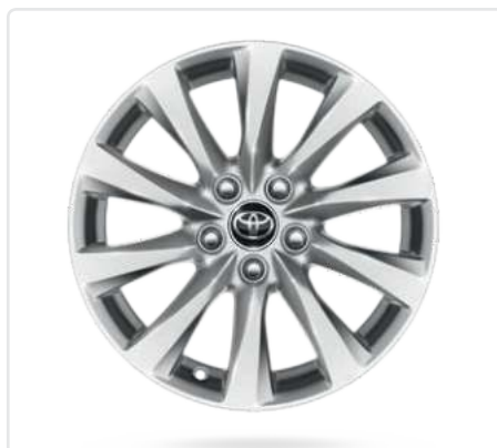
Легкосплавні диски 16"