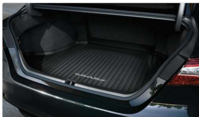
Килимок багажного відділення