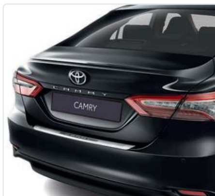
Захисна накладка заднього бампера