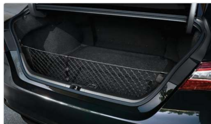
Вертикальна сітка кріплення вантажу