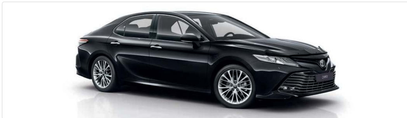
Дефлектор вікон з хромованим окантуванням