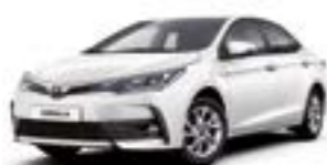
070 Білий перламутр 2