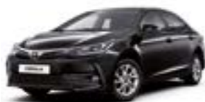
209 Чорний 2