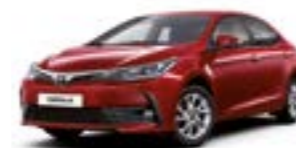
3T3 Червоний перламутр 2