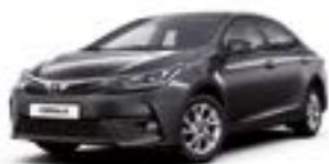
1G3 Сірий 2