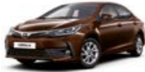
4U3 Коричневий 2