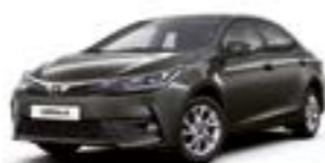
1G2 Сірий 2