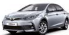
1F7 Сріблястий 2