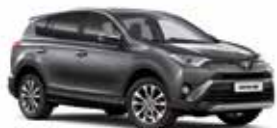
1G3 Сірий 2