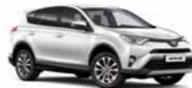
070 Білий перламутр 2