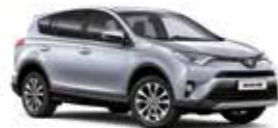
1F7 Сріблястий 2