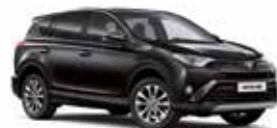
209 Чорний 2