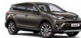
4U5 Темно-коричневий 2