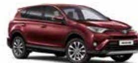
3T0 Темно-червоний 2