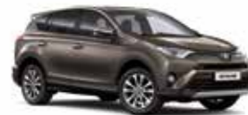
4T3 Бронзовий 2