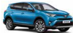
8X7 Блакитний 2

Вся інформація, представлена у цьому матеріалі, є точною та дійсною станом на дату публікації 18.12.2015. Імпортер автомобілів Toyota залишає за собою право вносити зміни до інформації, наведеної в цьому матеріалі, без попереднього повідомлення.