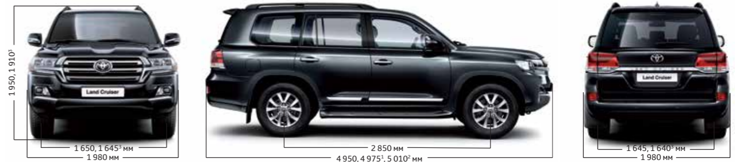
1 для комплектації Premium; 2 для комплектації Special Edition; 3 для комплектації Premium та Special Edition.